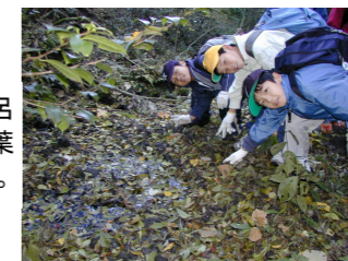
いのししの風呂場、使ったばかりで新しい。