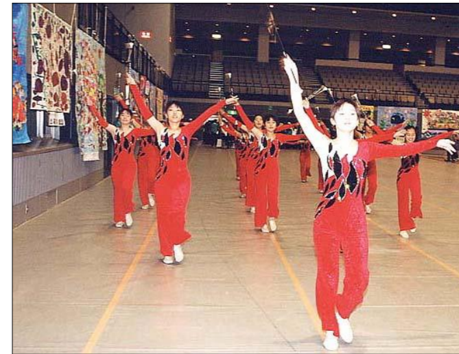
さあ、まつりの始まりです!