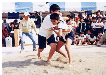
はっけよ〜い、のこった!