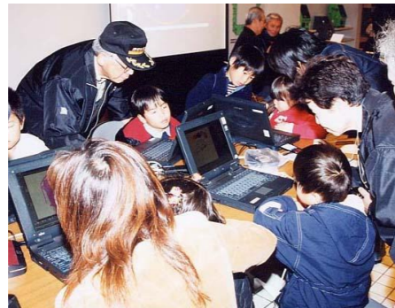
WEST21パソコン体験コーナー

今回の参加人数は約96,000人。公園のイチョウ並木の黄葉が、今年もみんなを出迎えてくれました。あちらこちらで出店やフリーマーケットが始まると、いっせいに人の波がどっと押し寄せてきました。大道芸広場などでは、見逃せないパフォーマンスがあったり、ふれあいステージでは踊りやバンド演奏など、地域の人たちによる楽しいステージショーが披露されました。