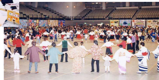
盛大なフィナーレ!