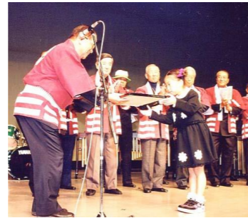
ポスター原画表彰