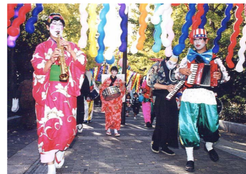
「ちんどんず」が今年も登場