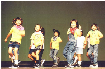
リズムにあわせ、ワン・ツー・スリー

設置や各ステージの準備などが始まり、資材や消耗品の搬入が続きつぎと行われ、午後には設備のリハーサルや案内板の設置がされました。夕方からホールのシート張りや絵の展示など、実行委員会、まつり委員会の皆さんは手際よく進められました。夜おそくまで、今年も本当にご苦労様でした。