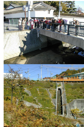
川の階段と人間の階段が並ぶ

天候は雲一つ無い快晴、冬間近とはいえ気温は20度を超え、歩けば汗ばむ日和でした。今回は、草津小などの小学生14人を迎え、水辺の楽校となりました。