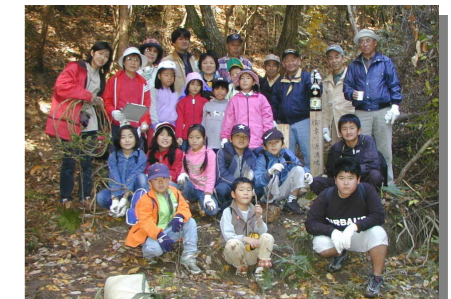
2年前の11月23日に建立した記念碑の横にサイン用の柱を立てて、記念写真