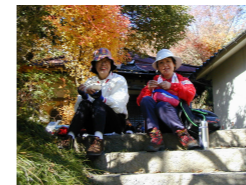
願いがかなう三角の石と聖水がある草津ゆかりの霊泉寺で昼食