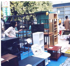
リサイクル家具は大盛況