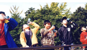
ラムネ早飲み一番!