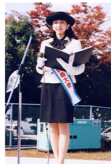
広島観光親善大使も一役