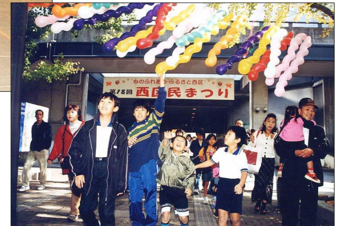
イチョウの黄葉とバルーンがお出迎え